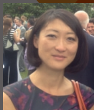
Fleur Pellerin, ministre déléguée aux PME, de l'Innovation et de l'économie numérique

Partant du constat que le principal frein à l'adoption des outils numériques est d'ordre culturel, le programme « Transition Numérique » cible les relais de proximité vers les entreprises. En constituant et en animant un réseau de « conseillers numérique » sur tout le territoire, et en fournissant à ces conseillers des outils pour monter en compétence et mieux répondre aux entreprises, ce programme permettra de sensibiliser et d'accompagner les PME dans leur appropriation du numérique.